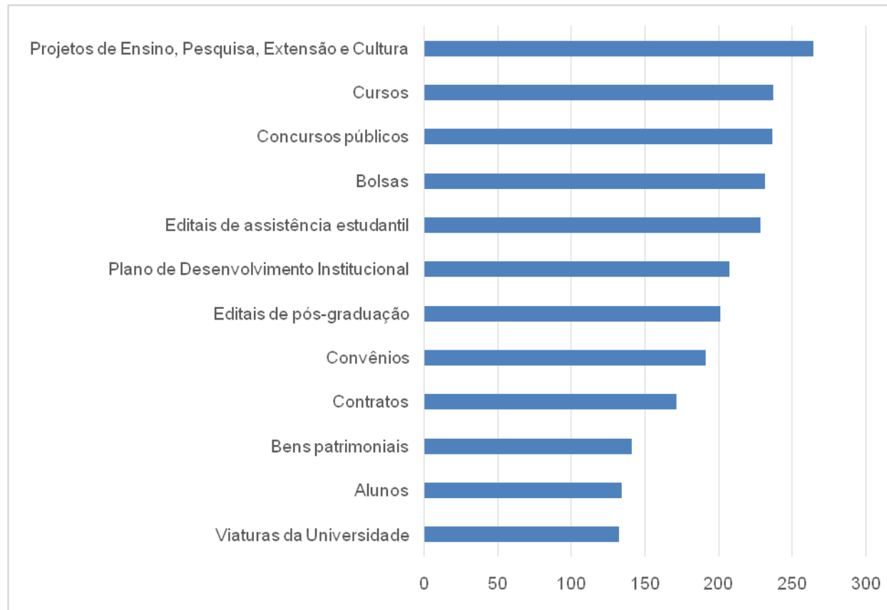
Figura 2 - Resultado da Consulta

A consulta pública teve 318 respondentes, tanto da comunidade universitária quanto da sociedade, em geral, tendo o seu resultado subsidiado a construção do cronograma de abertura (Anexo III). Os temas mais votados foram: (1) Projeto de Ensino, Pesquisa e Extensão; (2) Cursos; (3) Concursos Públicos; (4) Bolsas e (5) Editais de Assistência Estudantil. Essa última foi escolhida para compor o Projeto Piloto.